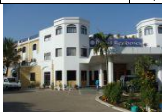
(ロイヤルレジデンス・ブダガヤ)