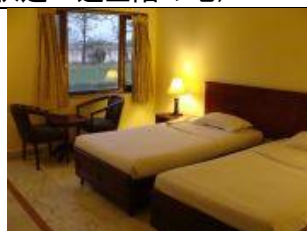
(ロイヤルレジデンス・クシナガラ)