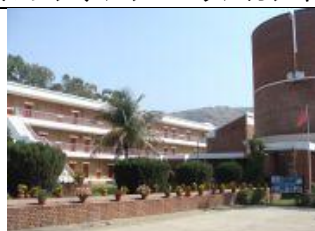
(インド法華ホテル・ラジギール)