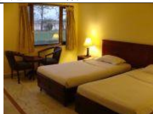
(ロイヤルレジデンス・クシナガラ)