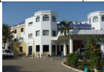
(ロイヤルレジデンス・ブッダガヤ)