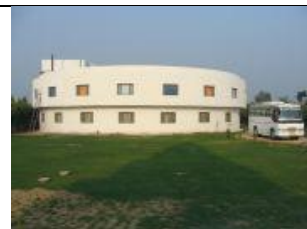
(ロイヤルレジデンス・サンカシャ)