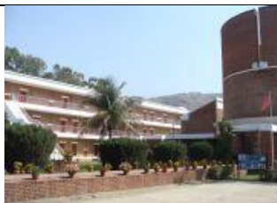
(インド法華ホテル・ラジギール)